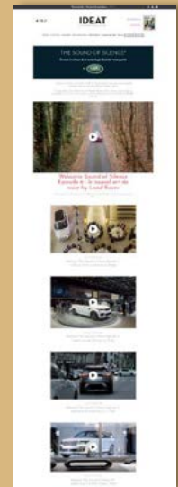
Exemple d'OPS pour Land Rover => Création d'un espace dédié et d'une web série « The Sound of Silence »