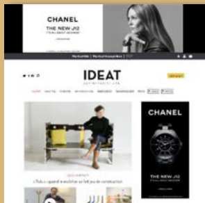
Exemple de Display classique pour Chanel