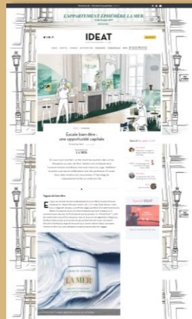
Exemple d'OPS pour La Mer => Création d'un article sponsorisé et médiatisation sur les réseaux sociaux